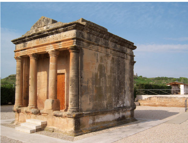
Siglo II d. de C.

En la foto vemos una maqueta de Fabara ubicada en dicha exposición y el Mausoleo al natural, aunque también puede verse en formato maqueta junto con otros monumentos de la comarca y numerosas curiosidades (en la exposición mencionada de José Vals).