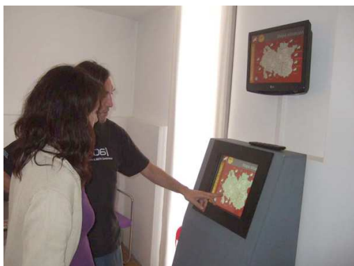
C.I. Cultura Ibérica

Completan la oferta caspolina el Centro de Visitantes que forma parte de la red de la Ruta de los Iberos (enclavado en un moderno edificio del Casco Antiguo, junto a las dependencias de la oficina de turismo) y el Centro de Interpretación de la Historia de la Autonomía de Aragón, ya que Caspe constituye un lugar simbólico, como sede del Congreso Autonomista de 1936, Capital del Consejo de Aragón guante la Guerra Civil y escenario reivindicativo en la década de los 70. El Centro se inauguró en el año 2005.