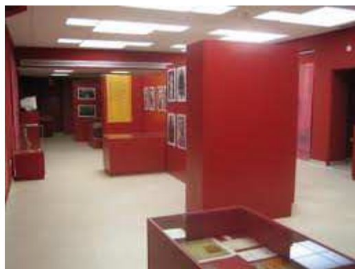
C.I. Hª de la Autonomía de Aragón