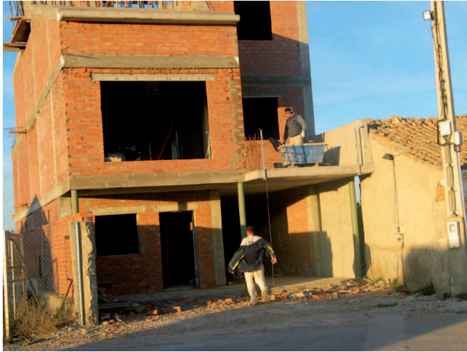
Inmigrantes trabajando en la construcción

han tenido un papel nada desdeñable, máxime cuando nos referimos al Plan de la Minería del Carbón y Desarrollo Alternativo de las Comarcas Mineras (1998-2005), firmado por los sindicatos FIA-UGT y CC.OO. y el Gobierno central.