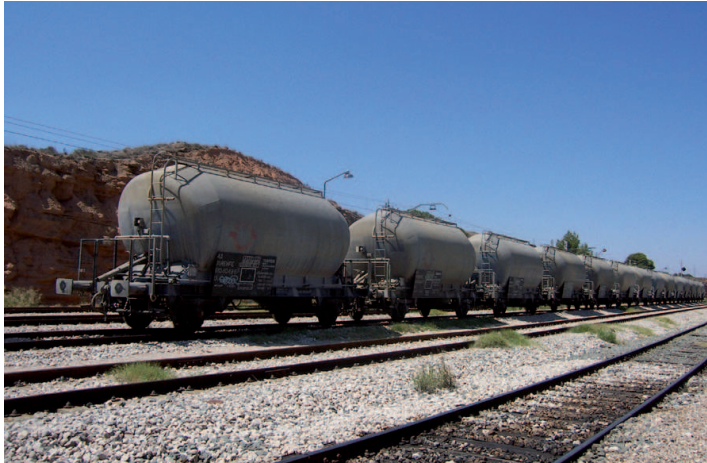
Samper de Calanda. Tráfico de mercancías en la estación de ferrocarril

Por lo que se refiere a los afiliados en alta laboral en la Seguridad Social, en los cinco años comprendidos entre diciembre de 2000 y 2005 su número ha aumentado un 36,2% en términos porcentuales, sobresaliendo el formidable dinamismo de la construcción y el transporte. Dentro del sector servicios cabe destacar la creación de empleo en el comercio 1 , la hostelería –acompañando el desarrollo de plazas en