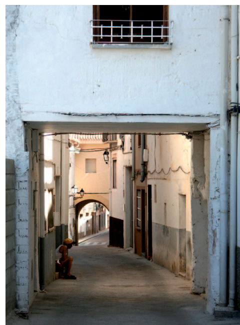
Urrea de Gaén

Desde una perspectiva socioeconómica la última década del siglo XX se ve determinada principalmente por dos factores: la continuación del proceso de transformación de la agricultura tradicional, tendencia por lo demás extrapolable con pocos matices a otros espacios turolenses y acomodada a la nueva