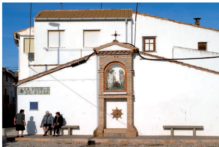
La Puebla de Híjar. Plaza del Charif