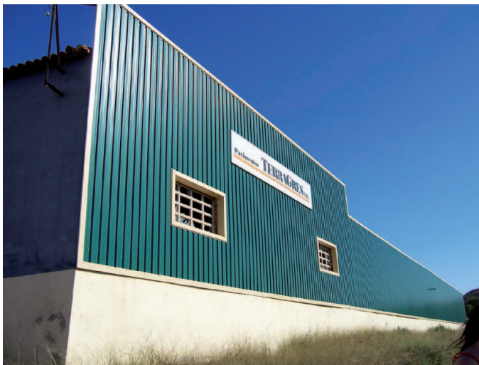
Híjar. Fábrica de pavimentos

Buscando la adecuación del marco carbonífero español a las directrices marcadas por la Unión Europea –concretamente a la Decisión 3632/93 de la CECA–, el Plan de la Minería contemplaba diversas medidas entre las que se encontraba la reducción de la producción de carbón en términos de demanda garantizada por parte