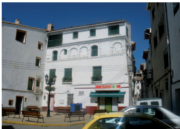
Híjar. Plaza de la Virgen

Tanto la información relativa a la apertura de centros de trabajo procedente del Instituto Aragonés de Seguridad y Salud Laboral como el número de cuentas de cotización de la Seguridad Social muestra un panorama de aumento del número de empresas en el Bajo Martín. Según esta última, en diciembre de 2005 hay 37 cuentas de cotización más que en el mismo mes del año 2000, y este incremento se localiza principalmente en Híjar y Albalate del Arzobispo. Destaca en la comarca la apertura de centros en los sectores de la construcción, y en ramas del sector servicios como el comercio al por menor, otras actividades empresariales y Administración pública.