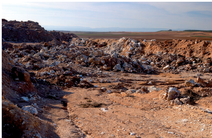
Azaila. Cantera de alabastro

Con objeto de desarrollar el sector, el 14 de diciembre de 1999 se constituyó la Asociación para el Desarrollo del Alabastro de Aragón (ADALAR), integrada por 25 ayuntamientos aragoneses, entre los que se encuentran los nueve de los municipios que conforman