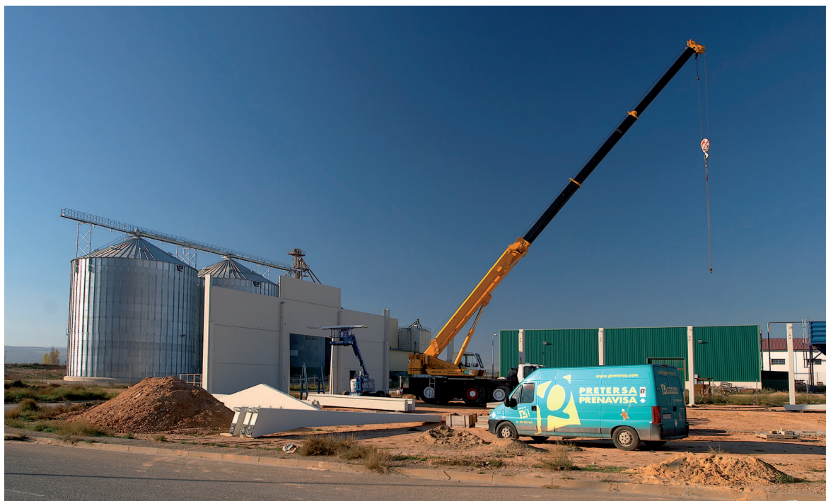
La Puebla de Híjar. Polígono industrial La Venta del Barro

desarrollo de infraestructuras de diversos tipos, como en suelo industrial 4 , la construcción de un área de expansión ganadera o mejoras en infraestructuras de transporte. En definitiva, apoyo a la localización y desarrollo de empresas, y actuaciones de infraestructuras entre las que se encuentran las de transporte y comunicaciones, que en el pensamiento económico actual gozan de amplio reconocimiento como elementos favorecedores del desarrollo a largo plazo al traer consigo una mejora del grado de comunicación y accesibilidad que permite reducir los costes de producción de las demás actividades económicas.